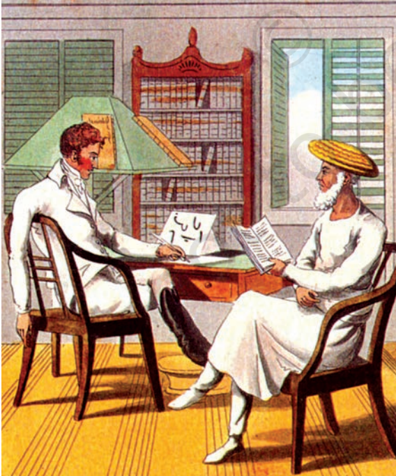
चित्र 1 - विलियम जोन्स फ़ारसी भाषा सीख रहे हैं।

इसके लिए कौन-से बदलाव लाए जाने थे? भारतीयों को शिक्षित, “सभ्य”, और अंग्रेज़ों की सोच के मुताबिक “अच्छी प्रजा” बनाने के लिए कौन-से कदम उठाए जाने थे? अंग्रेज़ों के पास भी इन सवालों के कोई बने-बनाए जवाब नहीं थे। इन सवालों पर कई दशक तक बहस चलती रही।