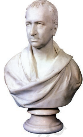
चित्र 2 - हेनरी टॉमस कोलब्रुक। वह संस्कृत तथा हिंदुत्व के प्राचीन धार्मिक ग्रंथों के विद्वान थे।

इन प्रयासों और विचारों से प्रभावित होकर कंपनी के बहुत सारे अधिकारियों ने दलील दी कि अंग्रेज़ों को पश्चिमी ज्ञान की बजाय भारतीय ज्ञान को ही प्रोत्साहन देना चाहिए। वे चाहते थे कि प्राचीन भारतीय ग्रंथों के अध्ययन को प्रोत्साहित करने और संस्कृत व फ़ारसी साहित्य व काव्य पढ़ाने के लिए संस्थानों की स्थापना की जाए। इन अधिकारियों का ये भी मानना था कि हिंदुओं और मुसलमानों को वही पढ़ाया जाना चाहिए जिससे वे पहले ही परिचित हैं और जिसे वे आदर और महत्त्व देते हैं। उन्हें अनजाने विषयों की शिक्षा न दी जाए। इन अफ़सरों की राय में, केवल तभी अंग्रेज़