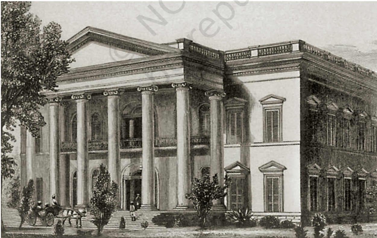
चित्र 7 - कलकत्ता के पास हुगली नदी के तट पर स्थित सेरामपुर कॉलेज।