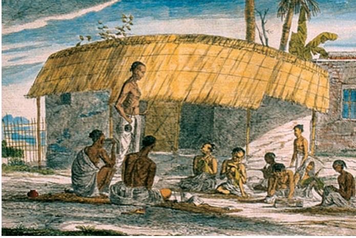
चित्र 8 - एक ग्रामीण पाठशाला।

यह फ्रांसवाँ सॉल्विन नामक डच पेंटर द्वारा बनाया गया चित्र है। फ्रांसवाँ अठारहवीं सदी के आखिर में भारत आए थे। अपने चित्रों में उन्होंने लोगों के दैनिक जीवन को दर्शाने का प्रयास किया है।