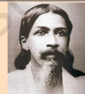
चित्र 9 - अरविंदो घोष

अरविंदो घोष ने 15 जनवरी 1908 को बॉम्बे (मुंबई) में अपने एक सम्भाषण में राष्ट्रीय शिक्षा पर बोलते हुए कहा कि इसका लक्ष्य छात्रों में राष्ट्रीयता का भाव जागृत करना है। इसके लिए अपने पूर्वजों के साहसिक कार्यों पर गहराई से चिंतन करना आवश्यक होगा। शिक्षा को मातृ-भाषा में होना चाहिए ताकि यह अधिक-से-अधिक लोगों तक पहुँच सके। अरविंदो ने इस बात पर भी बल दिया कि यद्यपि छात्रों को अपने मूल के साथ जुड़े रहना चाहिए, फिर भी उनको आधुनिक वैज्ञानिक आविष्कारों तथा लोकप्रिय शासन व्यवस्था के संदर्भ में पश्चिमी देशों के अनुभव का भी भरपूर लाभ उठाना चाहिए। इसके अतिरिक्त छात्रों को कोई हस्तकला भी सीखनी चाहिए ताकि वे स्कूल छोड़ने पर यथा संभव रोज़गार पा सकें।