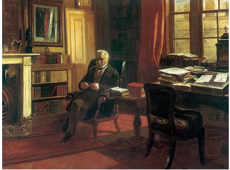
चित्र 4 - थॉमस बैबिंगटन मैकॉले और उनका अध्ययन कक्ष।

1830 के दशक तक प्राच्यवादियों का विरोध और तीखा हो गया था। थॉमस बैबिंगटन मैकॉले इन आलोचकों में सबसे मुखर और प्रभावशाली विचारक थे। वह भारत को असभ्य देश मानते थे जिसे सभ्यता का पाठ पढ़ाना जरूरी था। मैकॉले के मुताबिक, पूर्वी ज्ञान की कोई भी शाखा इंग्लैंड की प्रगति के समकक्ष नहीं थी। मैकॉले का कहना था कि “एक अच्छे यूरोपीय पुस्तकालय का केवल एक खाना ही भारत और अरब के समूचे देशी साहित्य के बराबर” है। उनका तर्क था कि भारत में ब्रिटिश सरकार को प्राच्यवादी ज्ञान पर सरकारी पैसा बरबाद नहीं करना चाहिए क्योंकि इससे कोई फ़ायदा होने वाला नहीं है।