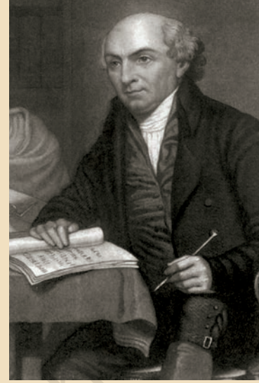
चित्र 6 - स्कॉटलैंड के ईसाई प्रचारक विलियम केरे जिसने सेरामपुर मिशन की स्थापना में मदद की।

उन्नीसवीं सदी के दौरान पूरे भारत में प्रचारक स्कूल खोले गए। परंतु 1857 के बाद भारत की ब्रिटिश सरकार प्रचारक शिक्षा को प्रत्यक्ष सहायता देने में आनाकानी करने लगी थी। सरकार को लगता था कि स्थानीय रीति-रिवाजों, व्यवहारों, मूल्य-मान्यताओं और धार्मिक विचारों से किसी भी तरह की छेड़छाड़ “देशी” लोगों को भड़का सकती है।