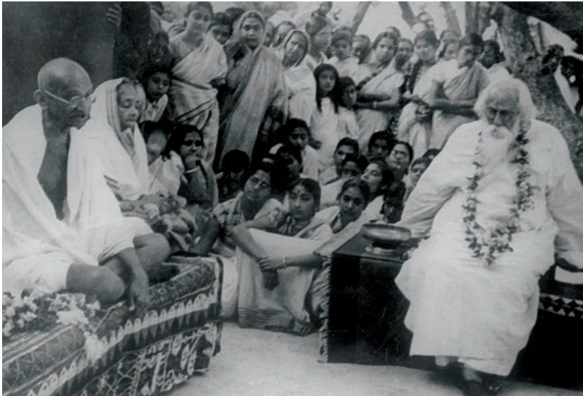
चित्र 10 - महात्मा गांधी और कस्तूरबा गांधी शांतिनिकेतन में रवीन्द्रनाथ टैगोर और लड़कियों की एक टोली के साथ बैठे हैं, 1940.

जीवन अनुभवों और व्यावहारिक ज्ञान की उपेक्षा की जाती है। गांधी का तर्क था कि शिक्षा से व्यक्ति का दिमाग और आत्मा विकसित होनी चाहिए। उनकी राय में केवल साक्षरता – यानी पढ़ने और लिखने की क्षमता पा लेना – ही शिक्षा नहीं होती। इसके लिए तो लोगों को हाथ से काम करना पड़ता है, हुनर सीखने पड़ते हैं और यह जानना पड़ता है कि विभिन्न चीजें किस तरह काम करती हैं। इससे उनका मस्तिष्क और समझने की क्षमता, दोनों विकसित होंगे।